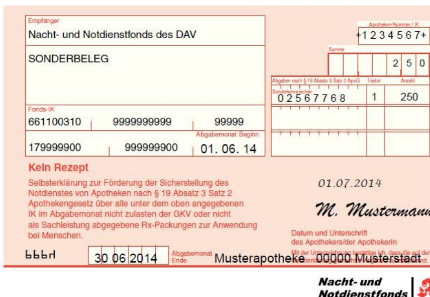
Abb. Muster Sonderbeleg „Selbsterklärung“

Sofern dem NNF die bei einem Inhaberwechsel notwendigen Informationen nicht bekannt sind, erfolgt die Abrechnung und Auszahlung an die dem NNF zum Quartalsende bekannten Kontaktdaten.